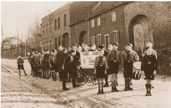
Abb. 11: Büchersammlung der HJ-Pimpfe aus Übach, hier in der Rimburger Straße.