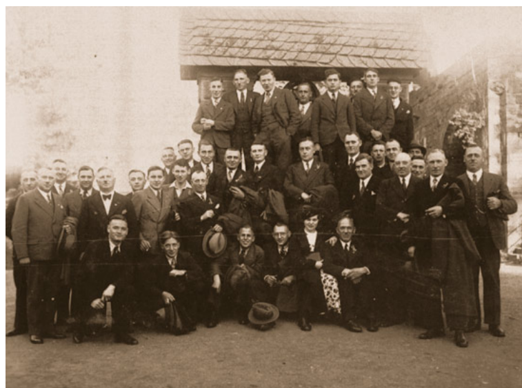
Abb. 6: Die Belegschaft des Rathauses in Übach im Jahre 1936.

geringerer Grenzverkehr. 24.5.: Der Bürgermeister gab den Gemeinderäten davon Kenntnis, dass infolge des Zuganges von Kindern auch die Schule Brünestraße der Erweiterung bedürfe. 24.5.: Ratssitzung der Gemeinde Übach-Palenberg im alten Rathaus: Beigeordnete Wynands (1.) und Küppers (2.) bestätigt; Grundstücksverhandlungen zum Rathausneubau: Geschwister Kochs sollen 3,- RM/qm erhalten. Erweiterungsbau an der Volksschule Boscheln soll 55.000,- RM kosten; Schaffung einer 7. Schulstelle an der ev. Schule in Palenberg, zwei neue Schulstellen in Boscheln. Bildung von Rücklagefonds; Grundstück für Erweiterung der Horst-Wessel-Straße gekauft. 24.5.: Königsvogelschuss der St. Sebastianus Schützen Übach. König wurde Josef Lesmeister. 31.5.: Marienlichter-Prozession in Boscheln, jeweils am letzten Sonntag im Mai.