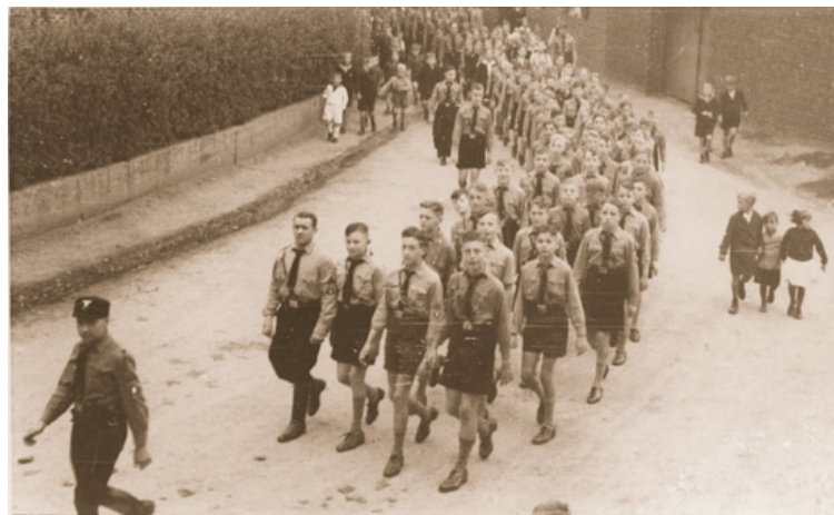
Abb. 8: Die Übacher Hitler-Jugend bei einem gemeinsamen Marsch durch Übach.