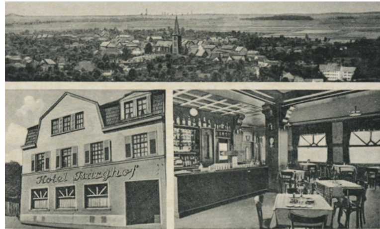
Abb. 3: Postkarte vom Hotel Burghof in Übach, Mitte der 30er Jahre.

2.3.: In Übach-Palenberg - wie in vielen anderen Orten Deutschlands auch - fanden sechswöchige Luftschutzkurse für HJ-Pimpfe statt mit Verhaltensweisen bei Bombenangriffen und Unterrichtung in Erste Hilfe. In Frelenberg wurden am Ende 50 Pimpfe geprüft. 7.3.: Wiederbesetzung des Rheinlandes durch deutsche Truppen. Vorher fuhren tagelang Militärtransportzüge durch Übach-Palenberg in Richtung Aachen. Vor diesem Hintergrund wurde auch die Wiedereinführung der Wehrpflicht verständlicher. 15. - 20.3.: Polizeiaufklärungswoche mit Filmen und Informationsblättern, beteiligt waren auch die Feuerwehren.