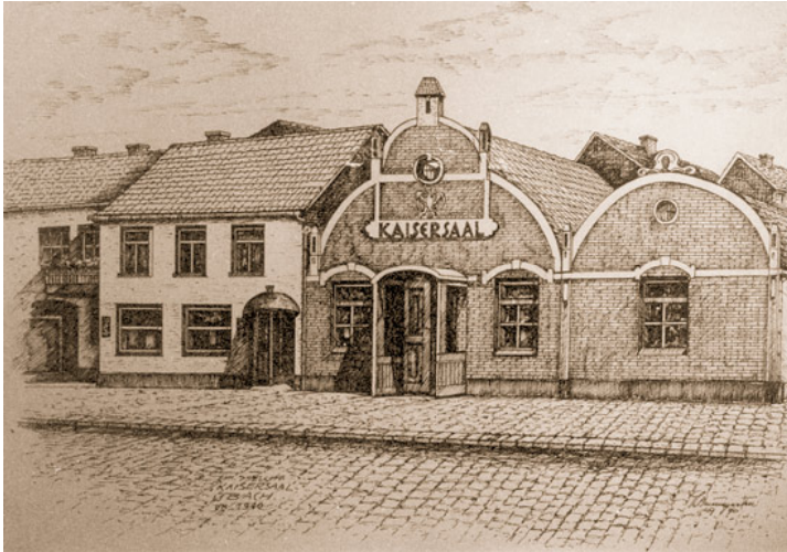
Abb. 1: Der Kaisersaal Mehlkop in Übach war vor allem in den 30er Jahren eine starke Anlaufstelle der örtlichen NSDAP, man könnte auch bald sagen, deren "Vereinslokal".

16.1.: Der erste Anthrazit-Gastriebwagen der Reichsbahn fuhr in Frelenberg und Palenberg vorbei. Ziel dieses neuen Antriebs war es, vom ausländischen Kraftstoff unabhängig zu werden.