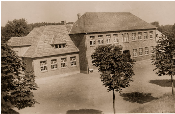
Abb. 10: Das Frelenberger Schulgebäude im Jahre 1936 vor Beginn des Erweiterungsbaus.