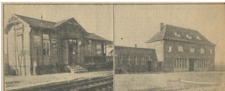
Abb. 2: Im Februar 1936 wurde der neue Bahnhof in Palenberg in Betrieb genommen. Hier ein Pressebild (WB) vom alten und neuen Bahnhof.