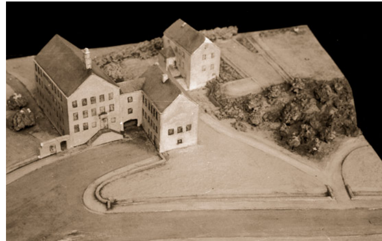
Abb. 12: Bald nach Gründung der Großgemeinde Übach-Palenberg ging es an die Planung eines neuen Rathauses. Hier ein Modell des geplanten Gebäudes.