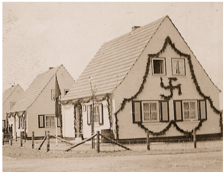
Abb. 5: Die neue Boschelner Siedlung des Reichsheimstätten-Werkes wurde am 2. Mai 1936 durch den Reichsarbeitsminister Dr. Robert Ley offiziell den Siedlern übergeben.

1.5.: Eine neue Treppe zur kath. Kirche in Frelenberg wurde fertiggestellt, nach dem ein Teil des Kirchaufganges abgerutscht war. 1.5.: Der ev. Hilfsprediger Emanuel Paskert begann seine Arbeit bei der ev. Kirchengemeinde in Übach-Palenberg. 4.5.: Ratssitzung der Gemeinde Übach-Palenberg im alten Rathaus: Nachtragssatzung zum außerordentlichen Haushalt für 1936 von 47.000,- RM für Schulerweiterungsbau Frelenberg, und 32.000,- RM Entwässerung Gehag-Siedlung; Friedhofsgebührensatzung, Aufnahme Darlehn Schulerweiterungsbau Frelenberg, Rathausneubau: Wiese der Geschwister Kochs in Aussicht genommen; Bergrat Scherer sagt Entfernung der Sperrmauer an der Carolus-Magnus-Straße zu, an deren Stelle Grünanlage. 13.5.: Strenge Kontrollen an der Landesgrenze in Marienberg und Scherpenseel, dadurch