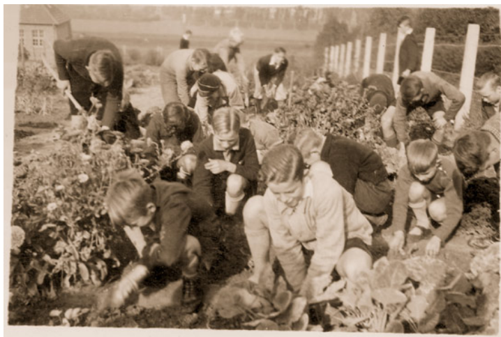
Abb. 7: Die Kinder sollten in der Schule auch einen direkten Bezug zur Selbstversorgung bekommen. Hier sind sie beim Anschauungsunterricht im Schulgarten.