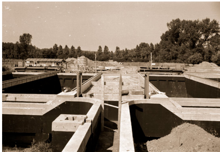
Abb. 8: Entstehungsphase der neuen Kläranlage in Frelenberg. Sie wurde notwendig, weil das Kanalnetz immer größer wurde und die Zeit der Sickergruben und Hauskläranlagen bald zu Ende gehen sollte.