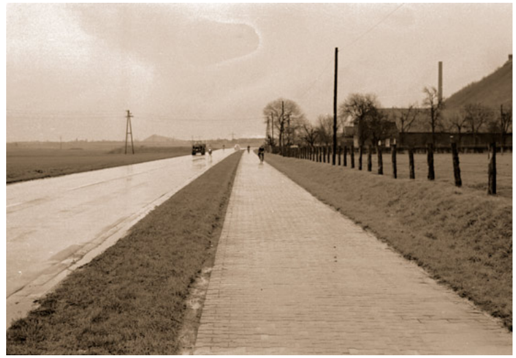
Abb. 16: Blick auf den im Jahre 1965 fertiggestellten Radweg von Boscheln nach Baesweiler.