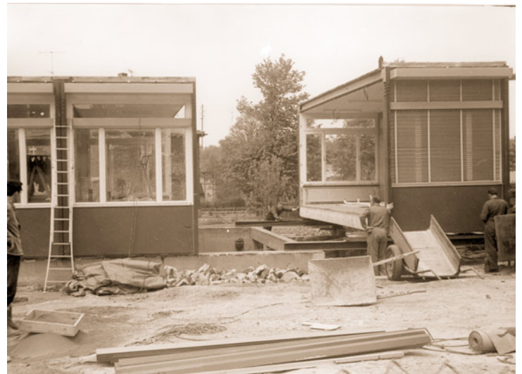
Abb. 5: Bau der Behelfsklassen des neuen Übach-Palenberger Gymnasiums in unmittelbarer Nähe der Volksschule Palenberg.