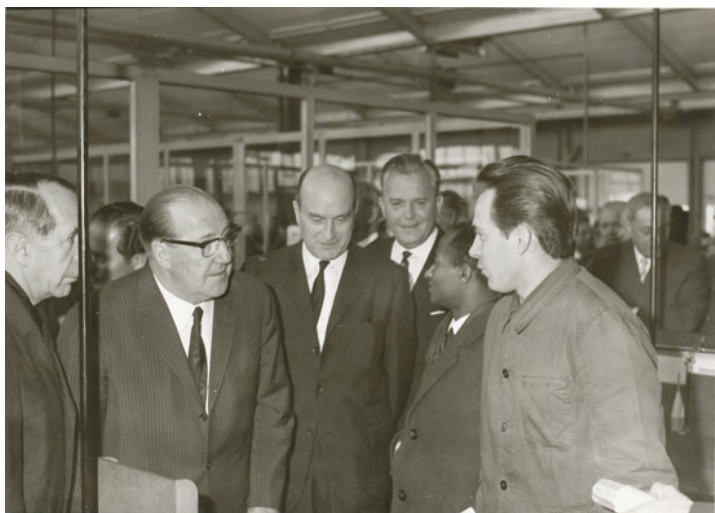
Abb. 13: NRW-Ministerpräsident Meyers zu Gast im Schlafhorst-Zweigwerk in Übach-Palenberg. Als gebürtiger Mönchengladbacher hatte er auch einen direkten öflichen Bezug zu dieser Firma.