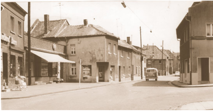
Abb. 3: Das Ende eines "alten Blicks" in die Talstraße in Übach. Der Fotograf stand in der Nähe der Einmündung des Kirchbergs.

"Wiener Blut" im Stadttheater Aachen. 31.3.: Pensionierung von Rektor Peter Jansen von der kath. Volksschule Boscheln. Heimatforscher und Naturfreund.