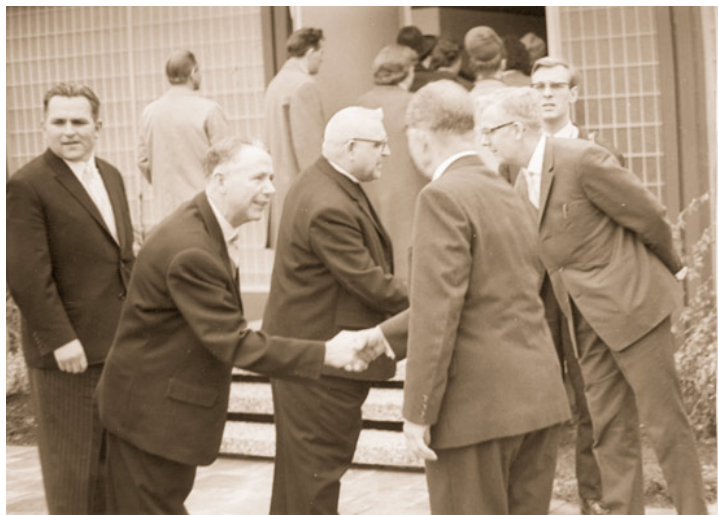
Abb. 6: Begrüßung der Gäste für die Einweihungsfeier des neuen Gymnasiums. Die neue Schule konnte also mit den ersten Fünftklässlern ihren Betrieb aufnehmen.