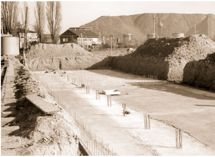
Abb. 15: Die Fundamente der neuen ev. Volksschule Palenberg in der Nähe der Maastrichter Straße. Diese Schule sollte der Auftakt zu noch weiteren Schulformen in der unmittelbaren Nähe sein.

20.11.: Kulturprogramm der Stadt Übach-Palenberg: Besuch der Oper "La Boheme" im Stadttheater Aachen. 20.11.: Die Presse berichtete, dass drei Jahre nach der CM-Schließung bisher 1000 neue Arbeitsplätze geschaffen worden waren. Insgesamt 4000 waren noch nötig. 22.11.: Pressemeldung über die Nutzung des Carolus-Verwaltungsgebäudes, späteres CMC. Kommen dort Soldaten hinein? 25.11.: Drei Häuser zur Verbreiterung der Fahrbahn (Marienberger Berg) wurden erworben. Anfang 1966 könnte mit dem Ausbau begonnen werden. 25.11.: PKW kam in Marienberg, In der Schley, von der Fahrbahn ab und stürzte in die Wurm. Feuerwehreinsatz. November: Verein für Vogelfreunde und Kanarienzüchter stellte im Lokal Malburg aus. Überall "piepte" es. 28.11.: Kirchenchor Übach sang "Messias" in der Pfarrkirche. In Gedenken an Pfarrer Pinner.