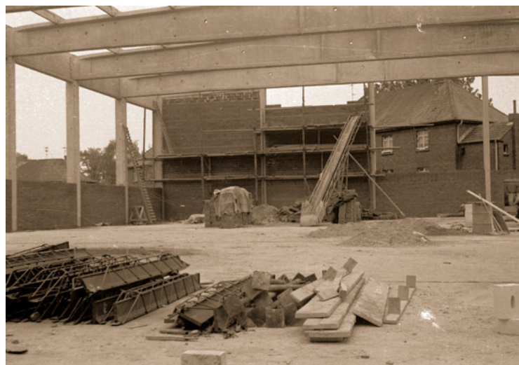
Abb. 2: Blick auf die Baustelle der Sporthalle in Palenberg, Barbarastraße.