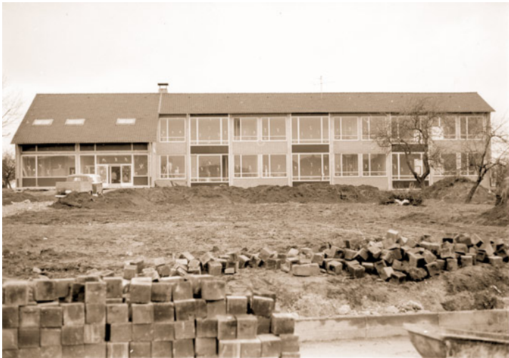
Abb. 4: Endphase des Neubaus der kath. Volksschule in Scherpenseel.