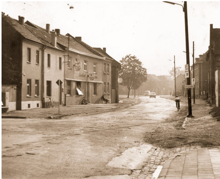
Abb. 12: Die Heerlener Straße in Scherpenseel rief, man solle sie doch verbessern. Der Gemeinderat ließ diesen "Ruf" nicht ungehört verhallen und schaffte in absehbarer Zeit Abhilfe.

FDP: 311 / 2,80 %, DFU: 104 = 0,91 %, NPD: 37 / 0,33 %. Zweitstimmen: Abgegebene Stimmen: 11.811, gültige Stimmen: 11.545, ungültige Stimmen: 266, CDU: 5.406 / 46,83 %, SPD: 5.552 / 48,09 %, FDP: 418 / 3,62 %, AUD: 6 / 0,05 %, GVP: 5 = 0,04 % DFU: 101 = 0,87 %, FSU: 3 = 0,03 %, NPD: 46 = 0,40 %, UAP: 8 = 0,07 %. Gewählt in Übach-Palenberg: Franz Vit (SPD, er zieht auch über die Landesliste in den Bundestag ein), gewählt auf Wahlkreisebene: Fritz Burgbacher (CDU). 25.9.: Fest- und Ehrenabend der IG "Bau Steine Erden" in der Festhalle. Jubilarehrungen bei 500 Gästen.