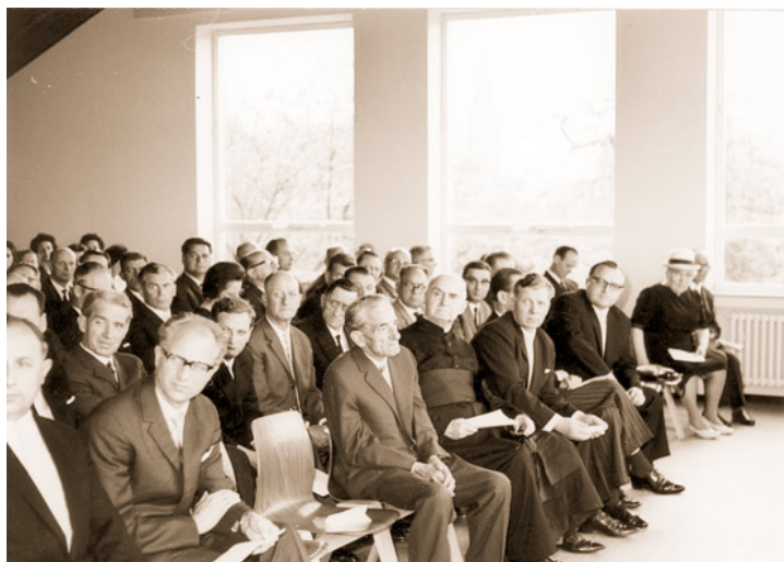
Abb. 7: Blick in die Gäste bei der Einweihungsfeier der neuen kath. Volksschule in Scherpenseel.

Juni: Westdeutsche Schwimm-Hallenmeisterschaften in Köln: Rudi Frings wurde Meister über 200 m Rücken in 2:22,0 Min. und 100 m Rücken in 1:04,1 Min. 8.6.: Ratsitzung: Ein 6-stöckiges Wohnhaus soll am Rathausplatz gebaut werden. 12.6.: Kreismeisterschaften der Leichtathleten im Stadion Übachtal. Udo Berners Meister im Kugelstoßen und Diskuswurf. 13.6.: Kulturprogramm der Stadt Übach-Palenberg: Besuch der Operette "Der Graf von Luxemburg" im Stadttheater Aachen. 16.6.: Einweihung der 6-klassigen kath. Volksschule in Scherpenseel.