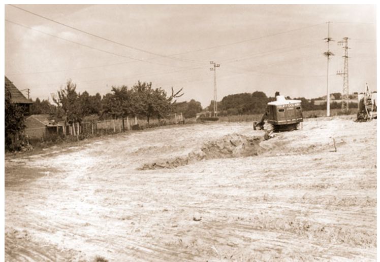
Abb. 11: Baubeginn der Schlichtwohnungen in der Nähe der Paul-Keller-Straße in Palenberg.