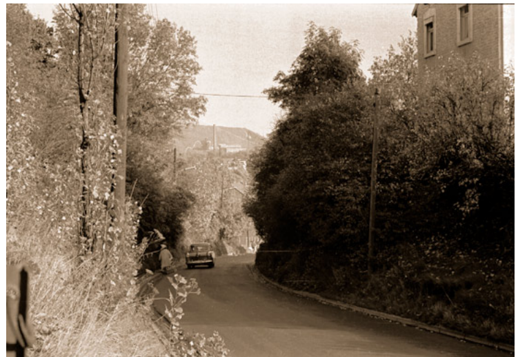
Abb. 14: Der Marienberger Berg erinnerte in den 60er Jahren an eine "Gebirgsstraße". Die Änderung dieser Straße hatte darum bis spätestens Ende der 60er Jahre Priorität.