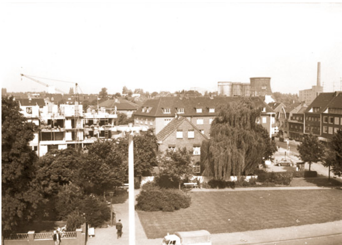
Abb. 10: Blick auf den Rathausplatz im August 1965. Ein sechsstöckiges Hochhaus entstand in diesen Monaten und veränderte damit das Erscheinungsbild des alten Rathausplatzes erheblich.

4.8.: Festabend zum 60-jährigen Bestehen der Feuerwehr Scherpenseel im Saal Kirchfink. August.: Viertes Rundstreckenrennen des RSV "Diana" in Übach-Palenberg. Publikumszuspruch nicht wie erwartet.