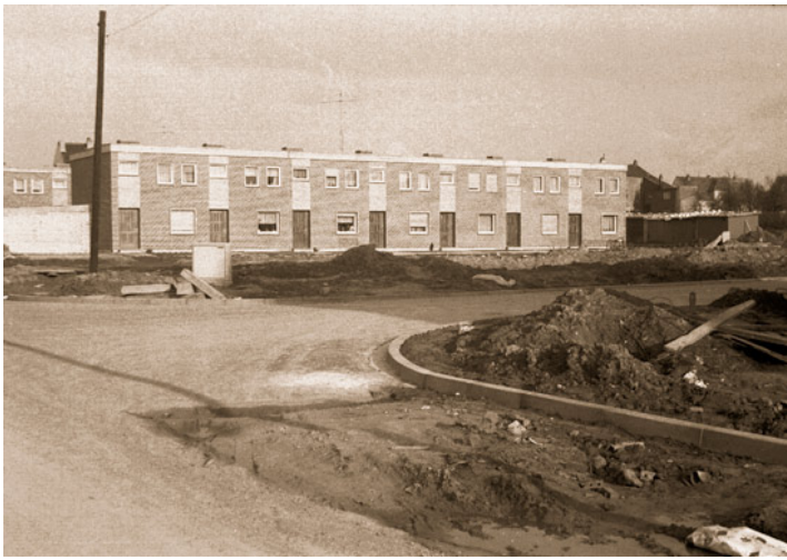
Abb. 9: Gegenüber der kath. Volksschule wurden zwei neue Wohnblocks gebaut. Der Auftakt zur späteren "Blumensiedlung" war damit getan.

Weltfestspielen für Gehörlose in Washington für Marlene Vonhasselt-Wallach (Leichtathletik). 11.7.: Kreismeisterschaften der Leichtathleten in Übach. Meister in Diskus und Kugel: Udo Berners (VfR), 100 m (A-Jgd.) Helmut Beckers (DJK Übach). 14.7.: Die Firma Woeste als neue Lötfittingfabrik in Boscheln eingeweiht. 17.7.: Westdeutsche Schwimm-Meisterschaften in Essen. Doppelmeister Rudi Frings in 200 m Rücken (2:22,4) und 200 m Delphin (2:27,1). 18.7.: Sommerfest der kath. Boschelner Pfarre an und um die Pfarrkirche. 20.7.: Im ehemaligen Kino (Rathausplatz) nahm eine Damenoberbekleidungsfabrik (Fa. Klaus Granderath) die Produktion auf. 23. - 25.7.: Siedlerfest in Boscheln mit Umzug und Kirmes. Fahnenweihe in der kath. Kirche. 24./25.7.: Bezirksschützenfest in Übach mit 25 Bruderschaften. Festzug, Kirmes und Bälle. Die begehrte Plakette ging nach Scherpenseel.