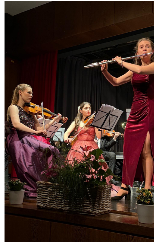
Impressionen des Neujahrskonzertes