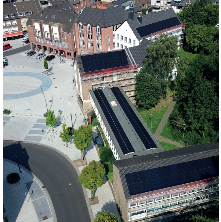
PV-Anlage Rathaus Übach-Palenberg

Zusätzlich sind Batteriespeicher mit insgesamt 49 kWh Energieinhalt installiert, die in Zeiten geringer Sonneneinstrahlung die Gebäude einige Stunden mit dem zuvor gespeicherten Strom weiter versorgen können. Der jährlich nutzbare Stromertrag beträgt insgesamt im Mittel ca. 30.000 kWh. Damit können ca. 11 t Treibhausgase (CO 2 -äquivalent) sowie ca. 2.600 € Stromkosten pro Jahr eingespart werden. Fragen zu PV-Anlagen oder zum Klimaschutz allgemein beantwortet Klimaschutzmanager Robert Mittelstädt gerne persönlich, telefonisch (02451/979-6620) oder per E-Mail (r.mittelstaedt@uebach-palenberg.de).