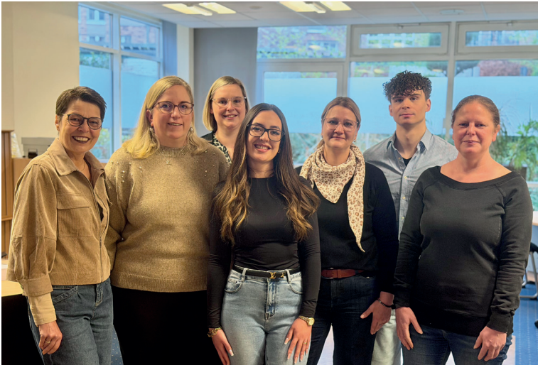
Das Team des Bürgerbüros.

Das Bürgerbüro informiert über neue Regelungen zur Terminvergabe