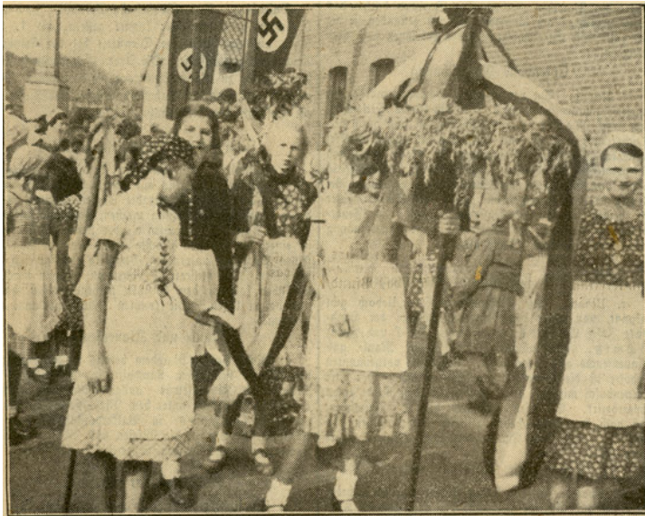
Die Erntefeiern der Ortsgruppe Palenberg fanden in Frelenberg statt. Wir zeigen einen Ausschnitt aus dem Frelenberger Erntezug