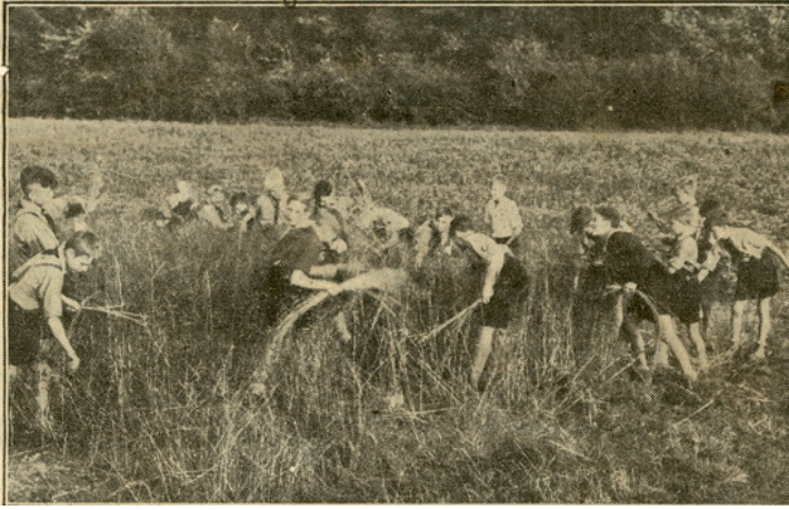
Abb. 9: HJ-Pimpfe aus Frelenberg halfen bei der Flachsernte. Diese Aktion war dem "Westdeutschen Beobachter" ein Bild und lobende Worte für den Einsatz der Kinder wert.