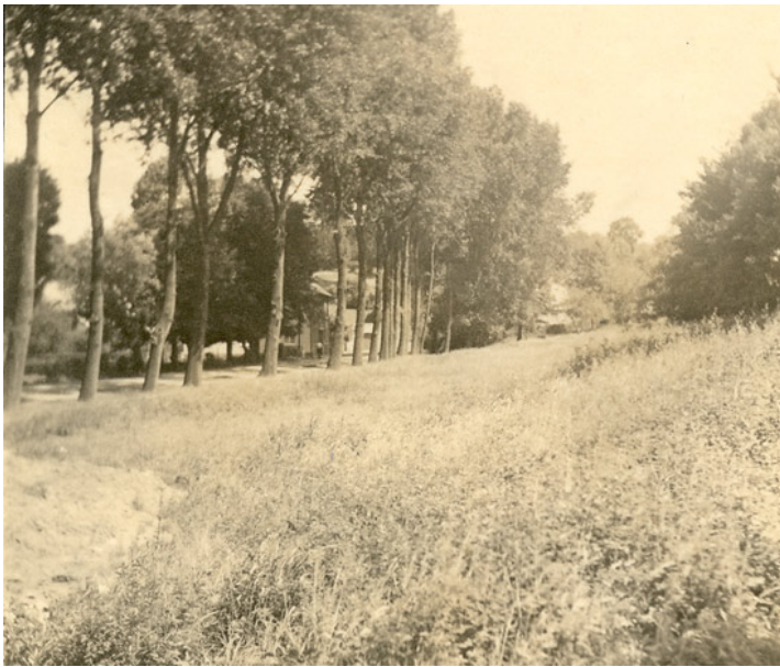
Abb. 6: Sommeridylle an der Dammstraße in Übach im Jahre 1937.

Brünestraße (Hambückerstraße) geplant, Grundstücksverkäufe, 150 RM Zuschuss an den Erntekindergarten in Scherpenseel, Carolus-Bibliothek kann auch von Werksfremden genutzt werden, Einbürgerung von Johann Feyer, Zuschuss von 100 RM für Sportplatzunterhaltung SV 09 Scherpenseel, kath. Volksschule in Boscheln soll "Wilhelm-Hambücker-Schule" genannt werden. Sonderrücklage von 30.000 RM für Rathausneubau in Haushaltsplan 1936. 24.7. - 24.8.: In Borheggen bei Gangelt fand das Zeltlager des Bannes und Jungbannes 389 statt mit 700 HJ-Jungen und Pimpfen aus dem Kreis, unter ihnen auch die HJler aus ganz Übach-Palenberg. 7.8.: Der Landrat gab das Verbot der Verfütterung von Brotgetreide bekannt, wozu Gerste und Hafer nicht zählten. 14.8.: Die Übach-Palenberger Polizei wurde angewiesen, Kollekten bei Bittgottesdiensten und Notopfer der bekennenden Ev. Kirche unauffällig und ohne Beunruhigung der Gottesdienstbesucher zu beschlagnahmen.