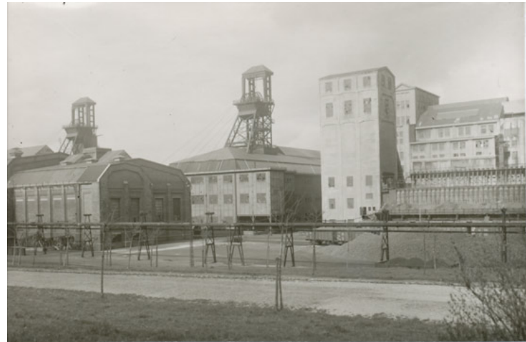
Abb. 11: Ein Blick auf die Grube Carolus Magnus im Jahre 1937.

1.11.: Es wurde festgestellt, dass die Gemeinde Übach-Palenberg über 7533,50 m Kanalisation verfügt. November: Baubeginn des neuen Volksschulneubaues incl. Schulleiter-Dienstwohnung in Marienberg (Schulstraße). 5.11.: Schweine- und Hühnerhaltung infolge Futtermangels - wie außerorts beobachtet - traf für Übach-Palenberg nicht zu. Viele Bergleute hielten ihre Hühner und Schweine mit Essensresten und hatten keine Probleme.