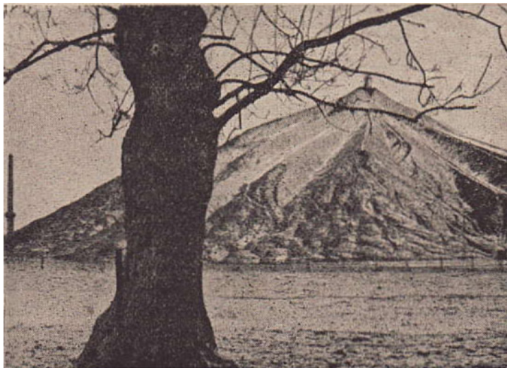
Abb. 1: Die Halde der Grube Carolus Magnus im Jahre 1937, veröffentlicht in einer Ausgabe des Kreisheimatkalenders.

1.1.: Ab 1.1.37 hörte der "Staatsjugendtag" als unterrichtsfreier Tag auf zu bestehen. Darum wurde der Samstag wieder zum Schultag. 6.1.: Umlegungsverfahren (Grundstücke) in Scherpenseel sollte 1937 umgesetzt werden. 15.1.: Ratssitzung der Gemeinde Übach-Palenberg im Lokal Drechers: Änderung der Hauptsatzung dahingehend, dass der Beigeordnete nicht haupt- sondern ehrenamtlich ist. Regierung sieht das nicht vor. Änderung Stellenplan, Einbürgerungsantrag beraten, Bericht über Schulerweiterungen in Frelenberg und Boscheln; die genehmigten Ordnungen der Gemeinde gelten auch über den 31.3.37 hinaus. Januar: Rattenbekämpfungsaktion in Übach-Palenberg nicht zufriedenstellend. 16./17.1.: "Tag der Polizei" mit Aufklärung und Sammlung für das Winterhilfswerk. Erlös für Palenberg: 133,40 RM, für Scherpenseel: 52,41 RM, für Übach: 109,61 RM, Zum Vergleich: Baesweiler sammelte allein 231,57 RM und war Spitzenreiter im Kreis. 17.1.: Antoniuskirmes der Übacher Schützen.