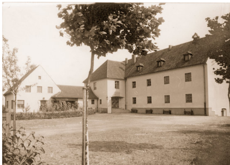
Abb. 5: Die neue Volksschule in Marienberg kurz nach ihrer Fertigstellung im Jahre 1937.

Juni: In Übach-Palenberg wurden 13 Bibelforscher festgestellt und in Schutzhaft genommen. Nach der Entlassung wurden alle überwacht. 20.6.: Gedenkfeier an der Mordstelle des Merksteiner SS-Führers Wilhelm Hambücker in Boscheln. Er war dort am 20.6.32 (angeblich) von Kommunisten erschossen worden. Angestrebt wird ein Denkmal in der Brünnestraße zu seinen Ehren. 26.6.: Vertrag zwischen der Gemeinde Übach-Palenberg und der Gewerkschaft Carolus Magnus: Werksbücherei auch für die Bevölkerung nutzbar. 30.6.: Im Jahre 1937 zogen mindestens 100 Neuapostolische Christen von Übach-Palenberg nach Westfalen und Salzgitter um. Grund: Unruhen auf der Zeche Carolus-Magnus. 30.6.: 1937 wurde Andreas Lies neuer Vorsteher der Neuapostolischen Kirchengemeinde Übach. 30.6.: Im Jahre 1937 wurde ein Kreuzweg von Billose´ und Prof. Klein für die Rektoratskirche St. Fidelis angeschafft. Diese Bilder waren von 1871 bis 1937 in Morsbach. 30.6.: Die Schülerzahlen in Übach-Palenberg zur Jahresmitte: kath. Volksschule Übach: 430, kath. Volksschule Boscheln: 544, ev. Volksschule Übach (incl. Boschelner): 260, kath. Volksschule Palenberg: 486, ev. Volksschule Palenberg: 370, kath. Volksschule Frelenberg: 305, ev. Volksschule Frelenberg: 100, kath. Volksschule Scherpenseel: 426, Gesamtzahl: 2.921. 30.6.: In Übach-Palenberg dienten 1937 dem Feuerschutz der Löschzug der Zeche Carolus Magnus, zwei Halbzüge der Feuerwehr Übach, ein Halbzug in Scherpenseel und einer in Frelenberg.