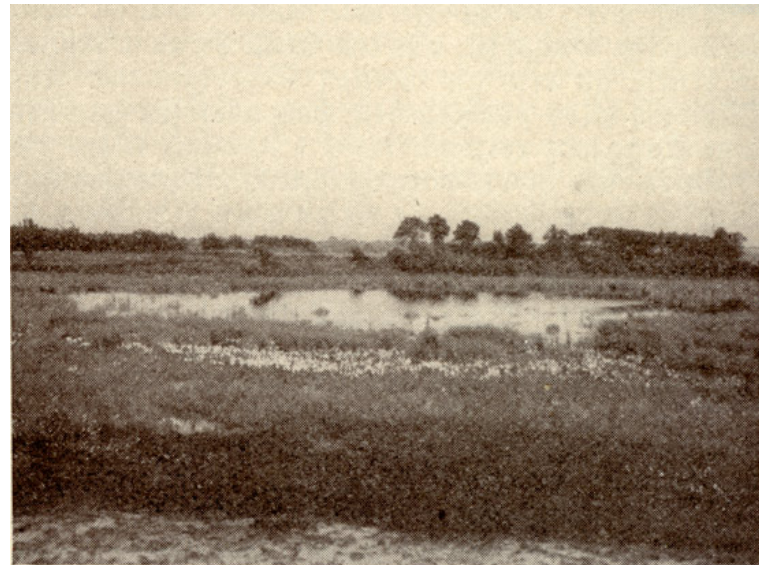
Abb. 2: Blick in die Scherpenseeler Heide im Jahre 1937, dargestellt in einem Heimatkalender des Kreises.