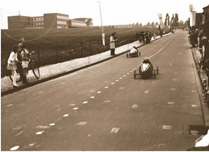
Abb. 8: Seifenkistenrennen auf dem Mühlenfeldweg in Übach. Links der Straße ist noch freie Sicht, im Hintergrund das neue Städtische Gymnasium.