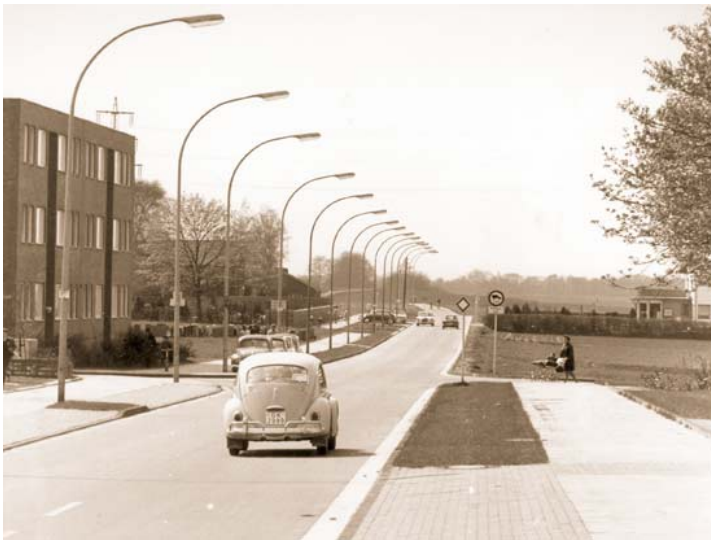
Abb. 9: Blick auf die Friedensstraße in Boscheln. Mit der Straßenbeleuchtung bekam diese als Gemeindeverbindungsstraße ausgelegte neue Straße ein ganz anderes Gesicht.