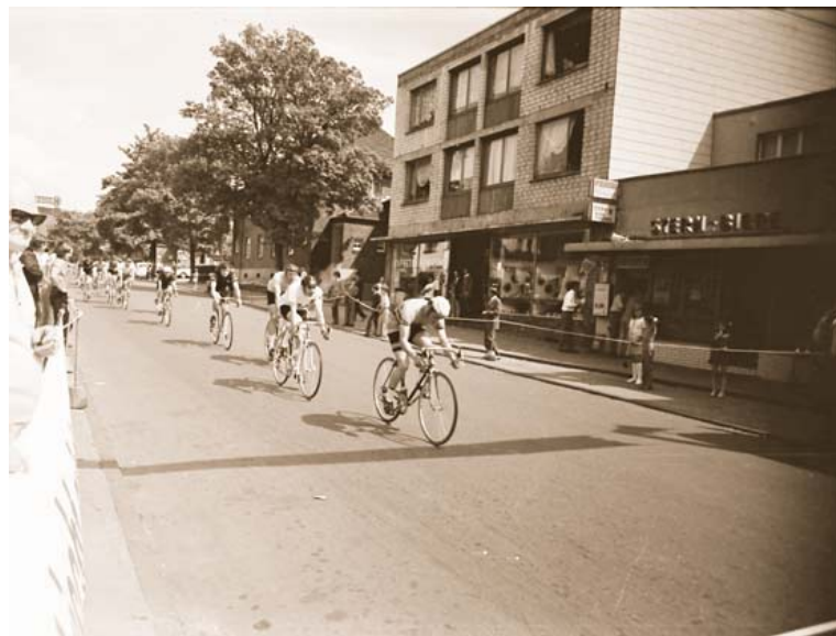
Abb. 7: Radrennen in Übach-Palenberg. Hier sind die Fahrer auf der Kirchstraße in Palenberg zu sehen.