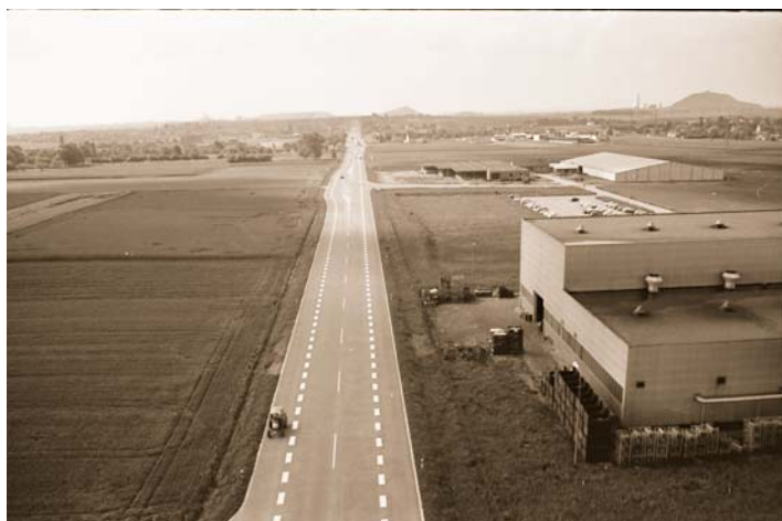
Abb. 3: Blick auf Gewerbegebiet Weissenhaus im Frühjahr 1971. Noch "gähnende Leere". Die Firmen Müller und Waldhausen haben den Anfang gemacht.