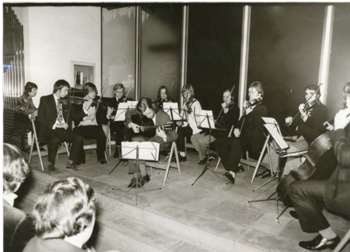
Abb. 13: Das neugebildete Kammerorchester bei seinem Konzert in der "Hütte der Begegnung".