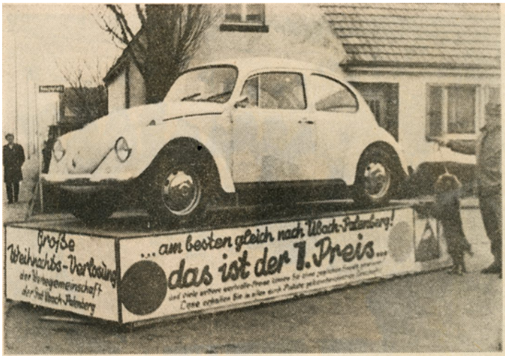
Das ist der Hauptgewinn der Weihnachtsverlosung der Werbegemeinschaft Übach-Palenberg: ein weißer Volkswagen, der in diesen Tagen im Stadtteil Boscheln zu bewundern ist. (Foto: GVZ)

Abb. 15: Dieser Preis der Werbegemeinschaft konnte sich echt sehen lassen. Pressefoto