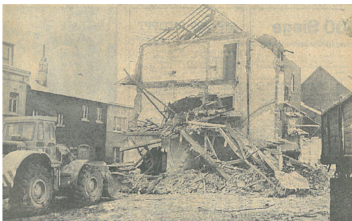
Abb. 1: Insgesamt 17 Häuser wichen in der Freiheitsstraße auf Grund einer besseren Verkehrsführung. Hier der Abriss eines Hause.

2.1.: Die Blaskapelle "St. Dionysius Frelenberg" wurde gegründet. Diese trat im Oktober desselben Jahres zum ersten Mal an die Öffentlichkeit. 4.1.: 17 Häuser wurden in der Freiheitsstraße abgerissen. Grund: Bessere Linienführung für den Straßenverkehr.