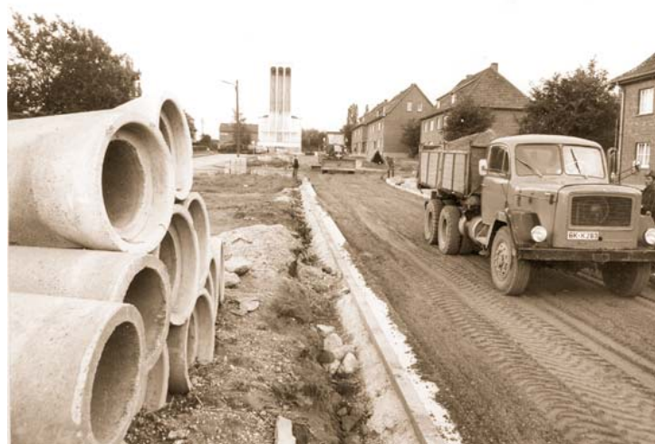
Abb. 6: Bauaktivitäten in der Carolus-Magnus-Allee in Palenberg. Die Straße sollte ein völlig neues Gesicht erhalten.