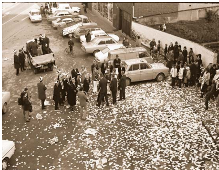
Abb. 2: Erfolgreicher Rathaussturm der "Narren aus Übach-Palenberg". Die verschossene "Munition" auf dem Rathausvorplatz zeigte, dass nach den Anstrengungen von Prinz Dittmar I. (Kollmer) und Gefolge schnell die Kapitulation im Rathaus erfolgte.