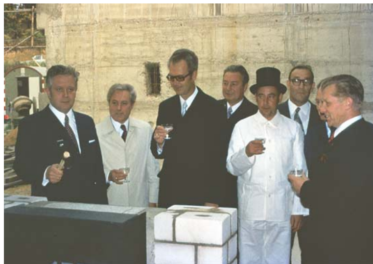
Abb. 13: Grundsteinlegung des geplanten Hallenbades in Übach.

1.10.: Der in Übach-Palenberg ansässige Künstler Theo Wolters stellte im Kreisheimatmuseum in Geilenkirchen aus. 1.10.: Kleine Feierstunde anlässlich des 25-jährigen Ortsjubiläums der kath. Schwestern in Palenberg. 3.10.: Großangelegte Eifelfahrt für die Senioren aus Übach-Palenberg (425 Personen in 9 Bussen). 3.10.: Gold-Meisterbrief für Hubert Jäger, 50-jähriges Bäckermeister-Jubiläum, Jülicher Straße. 7.10.: Weinfest des ÜGV 1848 in der Stadthalle im Rahmen der Herbstkirmes der Übacher Schützen. 8.10.: 800-jähriges Bestehen im Rahmen des Patronatsfestes von St. Dionysius Übach. 8.10.: Einsegnung der von den Schützen gestifteten Dionysius-Statue in der Pfarrkirche. 10.10.: Ratssitzung: Änderung der Hauptsatzung. Stadtbücherei bald in neuen Räumen in der KSK Palenberg.