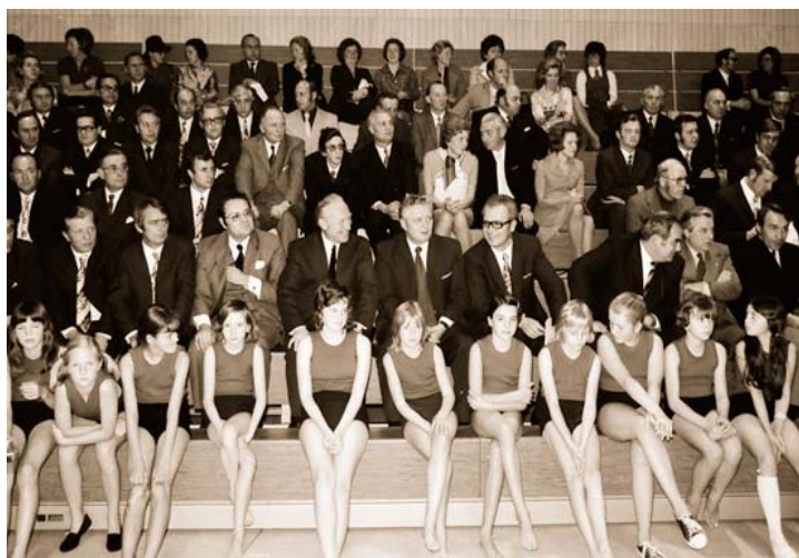
Abb. 15: Wieder ein großer Tag für Übach-Palenberg. Einweihung der neuen Großsporthalle in der Nähe des neuen Gymnasiums.

1.11.: Einweihung der neuen Friedhofskapelle in Scherpenseel. 3.11.: Einweihung der Turn- und Sporthalle des Gymnasiums, Comeniusstraße "Riesensporthalle".