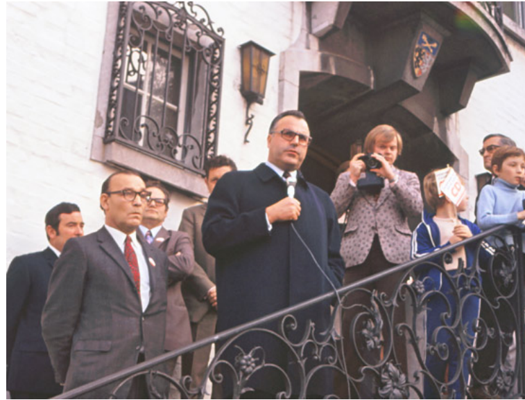
Abb. 16: Dr. Helmut Kohl, Rheinland-Pfälzischer Ministerpräsident auf der Rathausstreppe in Übach im Rahmen einer Veranstaltung zur Bundestagswahl.