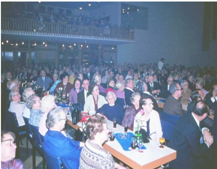
Abb. 1: Erste Städtische Seniorenveranstaltung in der Stadthalle. Jährlich einmal will die Stadt künftig die Senioren zu einem gemütlichem Nachmittag mit Programm einladen.