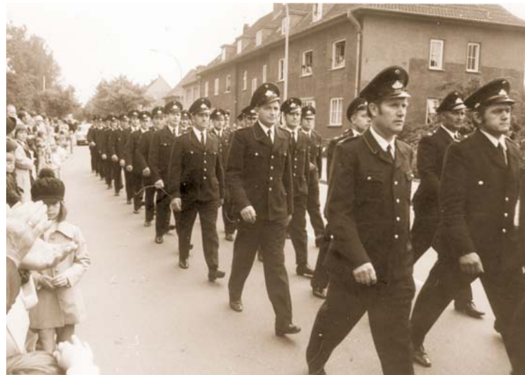
Abb. 7: Die Mannen der Übacher Jubiläumsfeuerwehr auf dem Festzug in der Dammstraße.