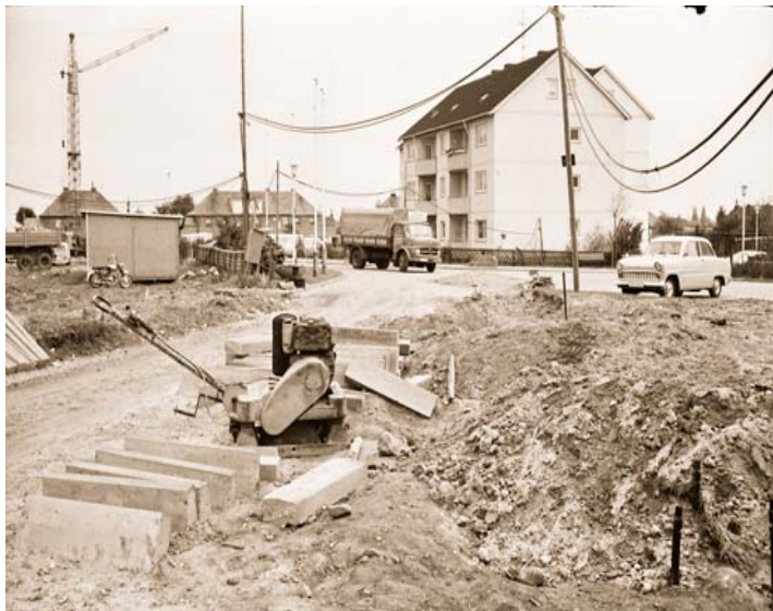
Abb. 3: Baustelle "Glückauf-Viertel" in Palenberg. Der Ausbau der Straßen schritt in diesen Monaten zügig voran.