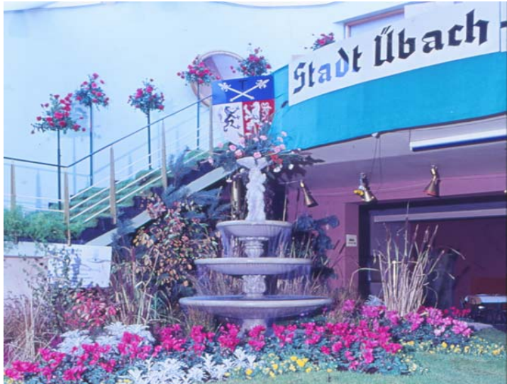
Abb. 11: Die Stadthalle wurde Blumenparadies im Rahmen des großen Erntedankfest der Übacher Gartenfreunde.