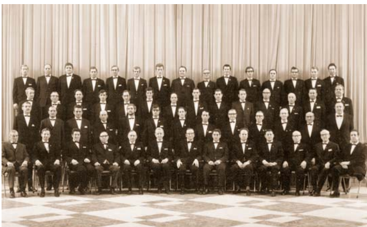
Abb. 4: So stellte sich der ÜGV 1848 im 125. Jahr seines Bestehens dar.