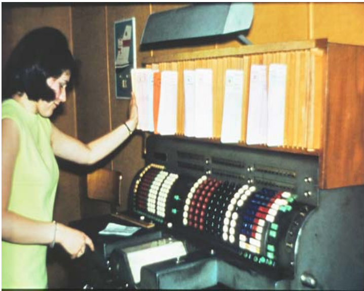
Abb. 17: Auch im Rathaus wurde immer neuere Technik eingesetzt. Hier eine Buchungsmaschine der Stadtkasse.