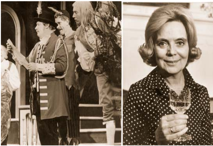
Abb. 5: Im Mai 1973 konnte Wolfgang Völz im Rahmen des Kulturprogramms begrüßt werden. Aber auch Heidi Kabel kam im Jahre 1973 zu einem Gastspiel nach Übach-Palenberg.