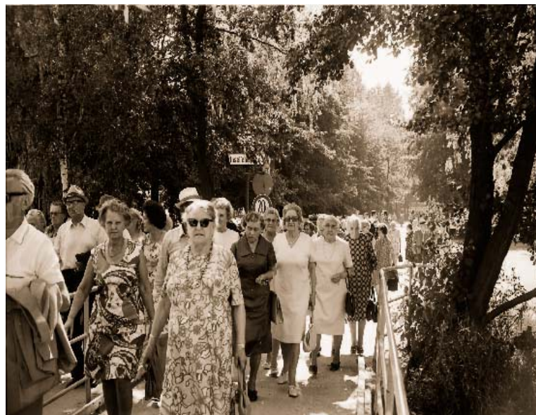
Abb. 11: Städtischer Ausflug von Senioren aus Übach-Palenberg nach Schwalmtal.