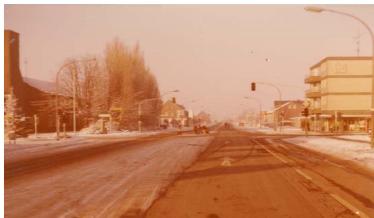
Abb. 16: Kein Auto auf der Roermonder Straße an diesem 25.11.1973. Das bundesweite Fahrverbot - ausgelöst durch die Ölkrise - ließ die B 221 zu einem Spazierweg für Fußgänger werden.