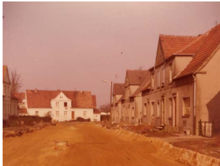
Abb. 14: Die Sanierung in Boscheln war in vollem Gang. Hier der Ausbau der Lindenstraße (späterer Nordring).