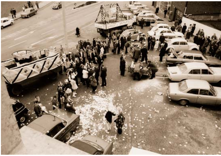
Abb. 3: Rathaussturm "Anno" 1973. Die wenigen Belagerer schafften eine schnelle Kapitulation.